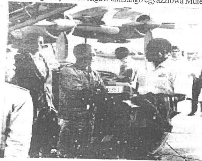
KABAKA ALINDA ENNYONYI OKUGENDA E BUNGEREZA

Amangu ddala nga yakawulira amawulire ago, pulezidenti Obote yategeeza nti newakubadde nga Uganda terina ndagaano na Burundi ya kuwanyisiganya bantu ababa bavudde mu nsi emu okulaga mu ndala, naye bwe kirikakasibwa ng'amawulire ago matuufu, Gavummenti ya Uganda yali ya kutegeeza Gavumenti ya Burundi nga Muteesa bwe yali tannava kuno, yaleka amaze okuzza emisango egimenya amateeka Gavumenti yali egenda kutegeeza Burundi nga bwe kiri ekikulu ennyo amawanga ag'omuliraano okusigala nga gakolagana bulungi mu ngeri y'omukwano. Uganda esubira nti Burundi n'amawanga amalala agagiriraanye gagenda kuyamba Gavumenti ya Uganda mu kusaba kwonna kw'eriba egasabye ku nsonga z'emisango egyazzibwa Muteesa.