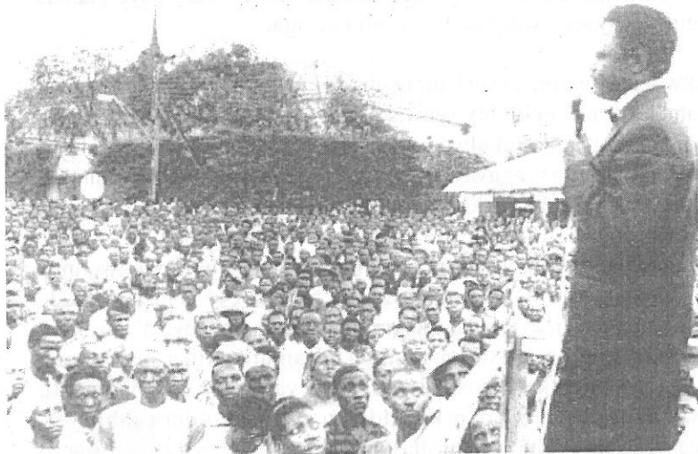
Mayanja Nkangi ng'ayogera mu lukunya aana lwa K.Y. ng'ekibiina tekinnawerwa

Ebyo nga bikyali awo, nga wayiseewo omwaka mulamba kasookanga omukago gwa UPC/KY gufa mu September 1964, awo nga ne 1965 nagwo gusenberera okukongoka, aba UPC mu National Assembly kwe kwecwacwana ne batandikawo olujeejeemo nti ekibiina kya KY kisaana kiwerebwe. Ensonga gye baawa baagamba nti KY kibiina kya bakyewaggula abatagoberera mateeka era abaagala okutabulatabula eddembe mu Uganda. Abantu bangi baali bakwatiddwa era nga bali mu nkomyo na ddala e Luzira.