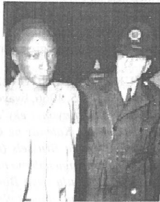
MUTEESA NG'ATUUKA MU BUNGEREZA

Amangu nga yakatuuka mu London, Sir Edward yagenze mu kimu ku bisenge bya televizoni era ne bamulaga buterevu ng'ayogera. Mu kwogera kwe yazeemu okunnyonyola eby'kubomba kwe okuva mu Lubiri e Mmengo. Kirabika nga taja kuba na bingi bya nnyo by'annyonyola ku byamutuukako, kubanga kigambibwa nti Gavumentu ya Bungereza yamutuukiridde ne musaba mu mwoyo mulungi aleme kwasanguza nnyo ebintu ebyo ssi kulwa nga kireetawo enkolagana yaayo ne Uganda okwonooneka."