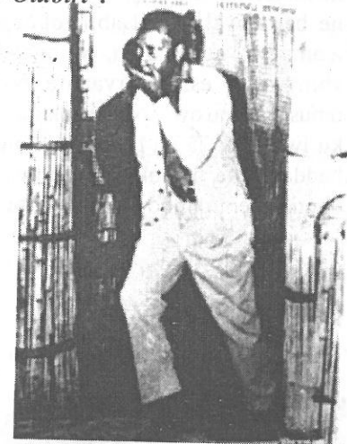
KABAKA AFULUMA OLUBIRI

"Kabaka Muteesa II bamusse n'abasirikale be bonna tekuwonye n'omu awamu ne Bakaawonawo ba Ssematalo ow'okubiri (1939 - 1945) abaali ebweru w'Olubiri".