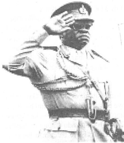
Generala Idi Amin Dada

akawungeezi k'olunaku olwo. Essaawa bwe zaatuuka nga kkumi ez'olweggulo January 25, ne kiwulirwa nga abantu bayita mu nguudo z'ekibuga nga bagenda baleekaana era nga bwe bafuwa enjombwe za mmotokaa obutaggyako."