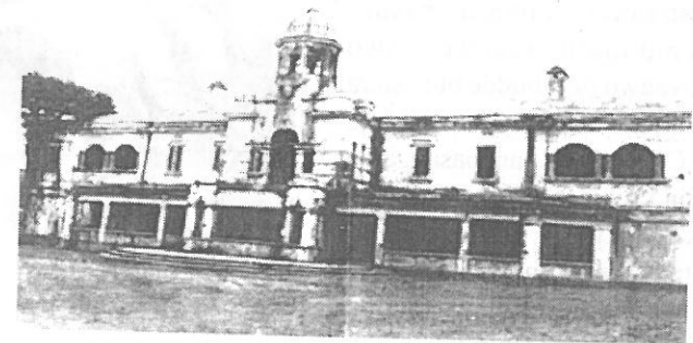
TWEKOBE NG'ABASERIKALE BAMAZE OKWEKOLA EKIGENYI

Ab'amagye bwe baawamba Olubiri, amayumba mangi ge baasangamu baagookya ne bookya ne Bulange Enkadde ne offisi ezimu ezaali empya. Ebintu byonna bye baasanga mu Twekobe zombi ne mu mayumba amalala byonna baabinyaga ne babitwala ne babyonoona. Mu bye baayokya ekyasinga obukulu ze ηηoma z'Obwakabaka, nnyingi ku zo nga zaava dda nnyo ziri mu Lubiri. Wewaawo waaliwo ezimu ezawoonawo ezitaali mu Lubiri naye nga ze ntono. Mu zaali ziwonyeewo ez'ekitiibwa ennyo, mwe mwali " Timba " eyajja ne Ssekabaka Kimera ng'ava e Bunyoro. Akalombolombo ka Buganda ak'obutakuumira Mujaguzo munda mu Lubiri ke kaayamba ηηoma ezimu ne ziwona.