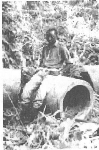
Awo yali awummuddemu oluvannyuma lw'okutambulira ebbanga eddene

Awo wabweru baasangawo emirambo mingi egy'amagye ga Obote naye tebaasangawo baserikale. Bwe baava awo ne balabawo omuntu eyalina mmutoka eya taxi n'abatwalako n'abatuusa ku nnyumba ya ba White Fathers e Lubaga. Abakulu abo baakkiriza kusuzaako abantu basatu n'emmundu zaabwe. Awo baavaawo ng'obudde bunaatera okukya olw'okutya nti basajja ba Obote bwe banabasangawo bajja kuvunaana ba Father abo Okuva awo e Lubaga baali batandise olugendo lwabwe oluwanvu nga lulimu ebizibu ebitalojjeka era emirundi mingi