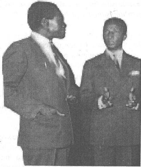
Omulundi ogwasembayo Muteesa n'Obote nga bakyali mu gavumenti. Obote alabika nga ayogeza bukambwe

Ntebe. Olwava mu nnyonyi n'atuuza olukiiko lwa Bannamawulire n'alyoka abategeeza nga bw'atalina ky'amanyi n'akamu ku ebyo byonna bye baali bamulumika. Oluvannyuma lw'ebyo yawalirizibwa Cabinet ye ne palimenti abeeko ne ky'akolawo ku nsonga ezo. Obote yalondawo akakiiko akabuuliriza mu bya zaabu n'amasanga era abantu bangiko baawa obujulirwa mu kakiiko ako, ebyama bingi ku kufuna n'okutunda zaabu n'amasanga ne bibikkulwa. Naye lipoota y'akakiiko bwe yaggwa teyagifulumya!