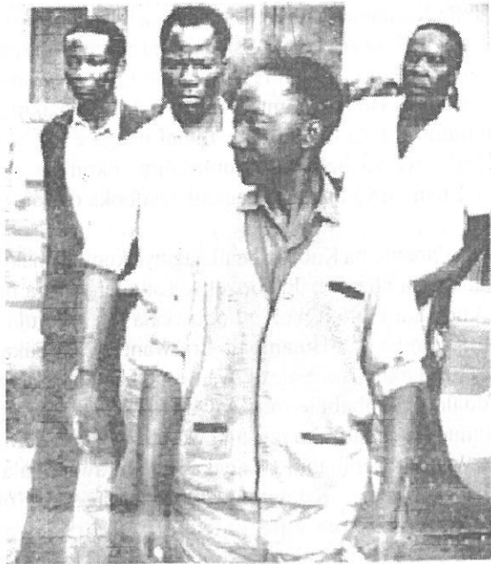
Abo be basajja be abaamukuuma mu lugendo lwe bwonna

Mu kitabo kye The Desecration of My Kingdom , kye yawandiika ng'atuuse e Bungereza, yagaana okwogera amannya g'abantu abaamuyamba mu buzibu buno bwe yalimu olw'okutya nti gavumenti yandibakoze akabi. Naye wetuwandiikidde ekitabo kino nga bangi ku bantu abo baafa dda naye be twamanyaako tusobodde okuboogerako ensi ebamanye awamu n'okubasiima olw'okwewaayo okuwonya obulamu bwa mukwano gwaffe Ssekabaka Muteesa. Ensonga endala etuboogezza lwa kuba nti embeera y'obufuzi kati yakyuka nga tewakyali ayinza kubakola kabi konna.