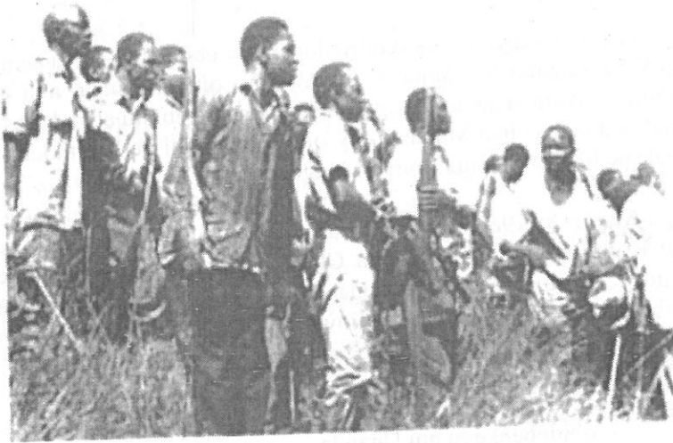
KABAKA N'ABALWANYI BE BEETEGEKERA OLUTALO

Emmundu zaatokotera mu Lubiri ne mu kitundu ekyo Ndeeba ne Kibuye okuva enkya mu matulutulu okutuusiza ddala eyo ku ssaawa nga kumi n'emu ez'olweggulo. Mu biseera ebimu yawulirwangayo emizinga egivuga naye nga ebiseera ebisinga zaalinga mmundu zino entono. Zaagiranga ne zisiriikirira, nga ate ziddaamu okuvuga okutuusiza ddala olweggulo.