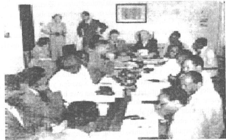
Akakiiko ka Wankoko